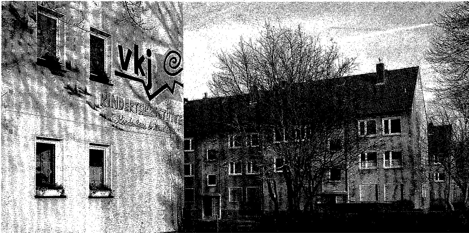
Soll umziehen: Die derzeitige Kindertagesstätte „Kleine Füße“ soll aus dem Gebäude Märkische Straße 25 in die Hausnummern 27 und 29 ziehen. Die Gruppen sollen vergrößert, zwei neue sollen dazu kommen. Auch eine Betreuung für Kinder unter drei Jahren soll installiert werden.

Im Mehrgenerationenhaus Märkische Straße sollen im Idealfall Senioren alleinerziehenden Müttern helfen und 91 Kinder bis zu sechs Jahren für Leben sorgen