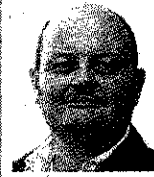
Von Detlef Leweux

Ob das Projekt „Märkische Straße“ und das Engagement der Allbau AG vor Ort im KURIER „bejubelt“ wurde, mag jeder Leser selbst entscheiden. Richtig ist, dass auch wir uns - bei aller Objektivität - darüber freuen, wenn sich im Stadtteil etwas Positives tut. Mehrgenerationenhaus, Kita, dazu moderne Allbau-Wohnungen, für mich bleiben das gute Nachrichten, auch wenn sie nicht zum Beschluss-Ablauf in den politischen Gremien passen; Einfamilienhaus-Wunsch hin oder her. Um ausgewogen zu bleiben, lassen wir heute einen Kritiker mit Insiderwissen zu Wort kommen. Warum das ausgerechnet der alte Lokalpolitik-Fuchs Soloach ist, muss sich seine Partei fragen.