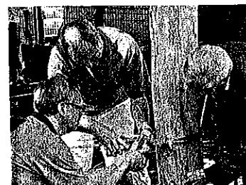
Rotary Club Essen-Ruhr

„Der Rotary Club Essen-Ruhr versteht sich als Service-Club und unterstützt eine Reihe von sozialen Projekten in der Stadt Essen. Bei dem Projekt „Kleine Hexe“ war es wichtig für uns, nicht nur durch Spenden zu helfen, sondern auch selber aktiv Hilfe anzubieten. Für die Teilnehmer, und natürlich auch für mich, war dieser Tag eine Bereicherung. Die Freude in den Augen der Kinder zu sehen, die bereits unmittelbar nach Fertigstellung die einzelnen Spielstätten ausprobierten, war der Lohn für alle, die an diesem Tag dabei sein konnten.“ Das Projekt „Kleine Hexe“ verzauberte auch das Umfeld der ehrenamtlich Aktiven: „Positive Erfahrungen, die die Rotarier an diesem Tag gemacht haben, waren in dem gesamten Freundeskreis des Rotary Clubs und auch in dem privaten und beruflichen Umfeld von großem Interesse und haben viele angeregt, über ähnliche Projekte nachzudenken. So werden beispielsweise Führungskräfte der National-Bank AG im November 2008 ein vergleichbares Projekt realisieren. Ich hoffe, dass die Initiative „Kleine Hexe“ weitere Nachahmer findet.“