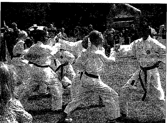
Auch die Krayer Vereinswelt - hier der RuhrDojo-Karatenachwuchs - wird stets in das Fest eingebunden.