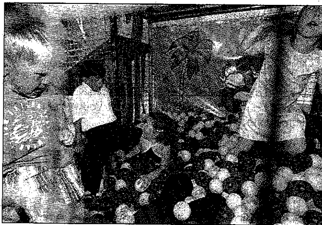
Hüpfen, Spielen und Toben, das alles ist beim Krayer Kinderfest im Volksgarten möglich.

Es wird eine Karaoke-Show bzw. eine Kinderhitparade auf