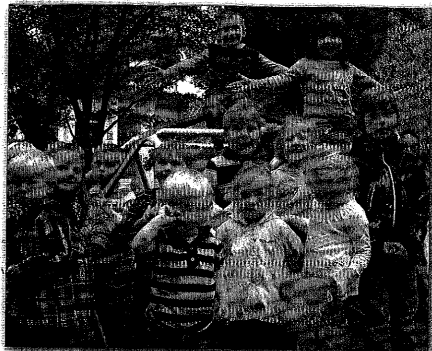
Auch die Schützlinge der Kita Leither Straße freuen sich auf das Kinderfest.

Unter dem Motto „Spielen verbindet - Freundschaft zählt“ möchten die Teilnehmer des Kinderfestes den Kindern einen tollen, erlebnisreichen Ferienabschluss und somit einen guten Start ins neue Schul- oder Kindergartenjahr ermöglichen. nvb