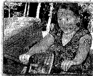
Mit Volldampf durch den Party-Park!

Freuen darf man sich zum Beispiel auf: Flizmobil, Brezel backen, Puppenspieler, Hüpfburg, Essen und Trinken, große Tombola, Gecko-Mobil, Panz Sales Haus, Power Trike,