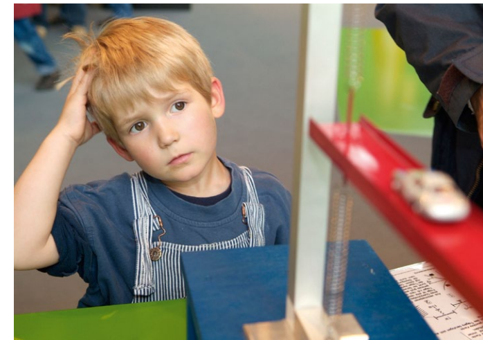
Kinder sind neugierig und lieben Experimente.