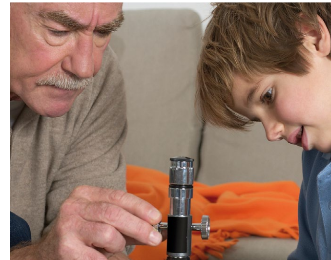
Aufmerksamkeit ist ein Geschenk.

Nach einem vorbereitenden Workshop besuchen Sie in regelmäßigen Abständen ausgewählte Kindertagesstätten des VKJ und führen dort gemeinsam mit den Kindern kindgerechte Experimente und Versuche durch. Unterstützt werden Sie hierbei von den pädagogischen Mitarbeiter/innen der Einrichtungen. Zurückgreifen können Sie auf einen Fundus an Versuchen und speziellen „Experimentierkästen für Kinder“ zum Beispiel zu Themen wie Wasser, Lotuseffekt, Materialdichte, optische Täuschungen, Mechanik und vieles mehr.